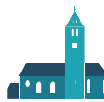
ST. JOHANNES BAPTIST HAISTERKIRCH

Das ZDF überträgt am Sonntag einen evangelisch-methodistischen Gottesdienst aus der Hoffnungskirche in Stuttgart(9.30 Uhr)-