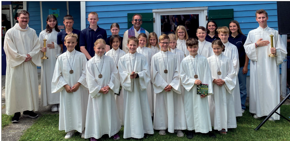
Die neu aufgenommenen Minis (13 der 15). Die Neuen tragen eine Plakette.