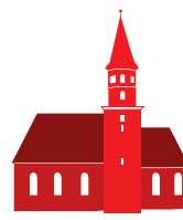
ST. JOH. EVANGELIST MICHELWINNADEN