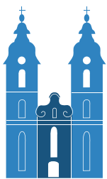
ST. PETER BAD WALDSEE