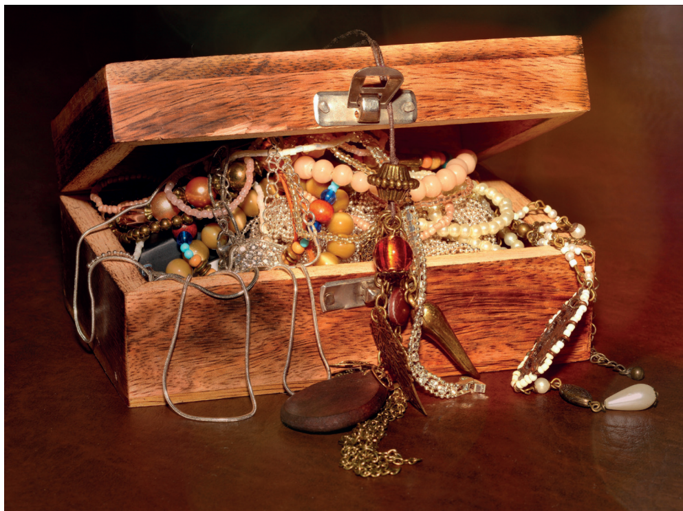
Mit dem Himmelreich ist es wie mit einem Schatz ...

Die Himmelreich-Gleichnisse sind in diesem Sinn Versuche, bildhaft zu erläutern, wie diese Verbindung der materiellen Welt mit der göttlichen Sphäre aussehen kann. Oder anders ausgedrückt: Wie in der irdischen Welt eine Erfahrung des Göttlichen gemacht werden kann.