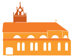
ST. PETER UND PAUL REUTE