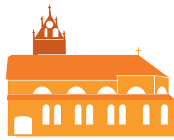
ST. PETER UND PAUL REUTE