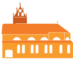
ST. PETER UND PAUL REUTE