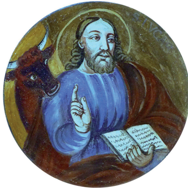
Buch und Stier sind die Attribute von Lukas in der bildenden Kunst. Gemälde in der Kapelle Siebenter Stöckl bei Antholz in Südtirol.

So wird bereits in der Geburtsgeschichte das Programm des späteren Lebens Jesu entfaltet: Sein Einsatz gilt den (in jederlei Hinsicht) Armen. Er wird keine Gewalt ausüben, sondern am Kreuz enden. „Das Kreuz bleibt nicht aus, wenn man sich für den Frieden der Gewaltlosigkeit entscheidet“, hat mein Theologieprofessor für Neues