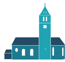
ST. JOHANNES BAPTIST HAISTERKIRCH