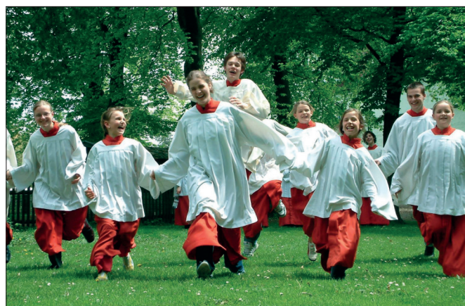
Ministrant-Sein macht Spaß.