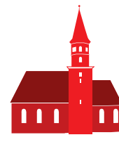
ST. JOH. EVANGELIST MICHELWINNADEN