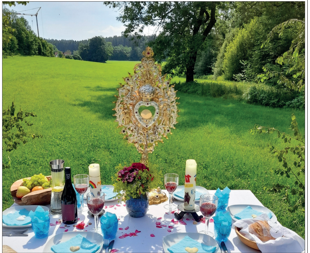
Ein festlich und reich gedeckter Tisch, von den Kommunionfamilien in Haisterkirch für den Prozessionsweg an Fronleichnam gestaltet, mit den Gruppenkerzen, mit den Namensschildern der Kommunionkinder, mit Brot und Wein/Traubensaft – und mitten darin, die Monstranz, der lebendige Christus in Gestalt des Brotes. Ein wunderbares Bild für das diesjährige Motto „Mit Dir am Tisch“, wie es hier im Wort zum Sonntag entfaltet wird.

Wenn wir in der Eucharistiefeier am kommenden Sonntag mit der Feier der Heiligen Kommunion mit Gott am Tisch sitzen und so seine Freunde werden, wird jenes letzte Mahl Jesu mit seinen Jüngern und Jüngern lebendig, das uns in den Evangelien überliefert ist: Jesus spricht den Lobpreis auf Gott, das Dankgebet zu seinem Vater. Dann teilt er Brot und Wein aus und sagt: „Esst, das ist mein Leib ... trinkt, das ist mein Blut.“ Gemeint ist: „Esst und trinkt, das bin ich für euch.“