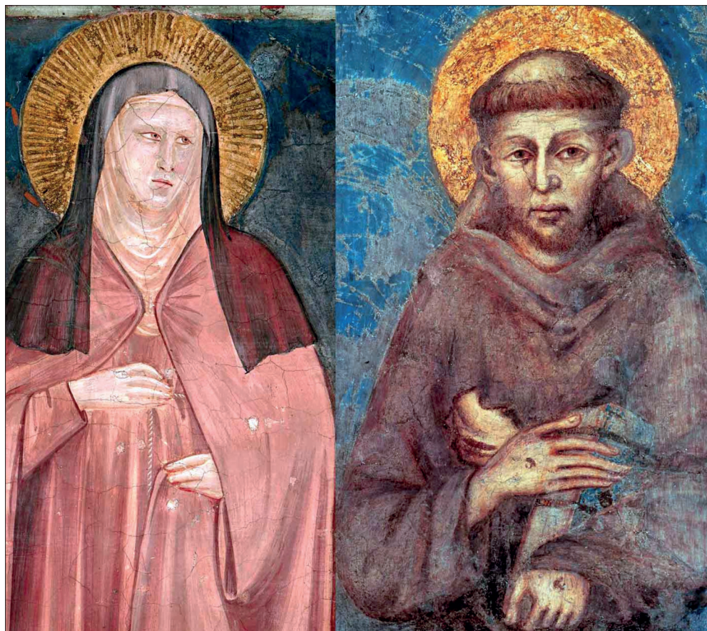
Darstellungen der Heiligen Franz und Klara in der Basilika San Francesco in Assisi.

Ich gehe ehrlich mit mir selbst um und wage den Weg der Umkehr zu Gott, meiner Mitte. In der Bitte um Erbarmen wird die Wahrheit meines Lebens deutlich: Ich bin arm und ver-