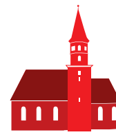
ST. JOH. EVANGELIST MICHELWINNADEN