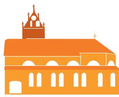
ST. PETER UND PAUL REUTE