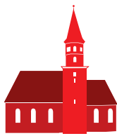
ST. JOH. EVANGELIST MICHELWINNADEN

KTV überträgt an diesem Sonntag, 21. November, um 9.30 Uhr ein Hochamt aus der Wallfahrtsbasilika zum Heiligen Blut in Walldüren. Und um 12.00 Uhr schaltet K-TV live nach Rom, wo Papst Franziskus den Angelus betet. Im Rahmen seiner kurzen Ansprache am Fenster des Apostolischen Palastes legt er üblicherweise das Tagesevangelium aus.