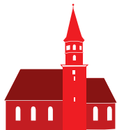
ST. JOH. EVANGELIST MICHELWINNADEN

19.00 Uhr: Andacht zu Peter und Paul (We)