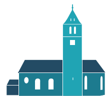
ST. JOHANNES BAPTIST HAISTERKIRCH