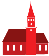
ST. JOH. EVANGELIST MICHELWINNADEN