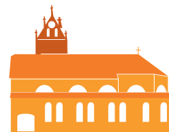
ST. PETER UND PAUL REUTE