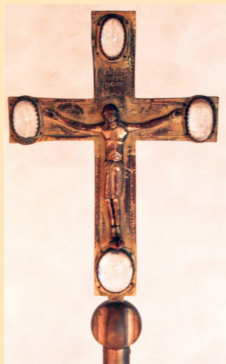
Bild: Das Zipplinger Kreuz, ein aus der Zeit der Romanik stammendes Kreuzifix, das seinen Platz in der Kapelle des Bischofshauses in Rotenburg hat.