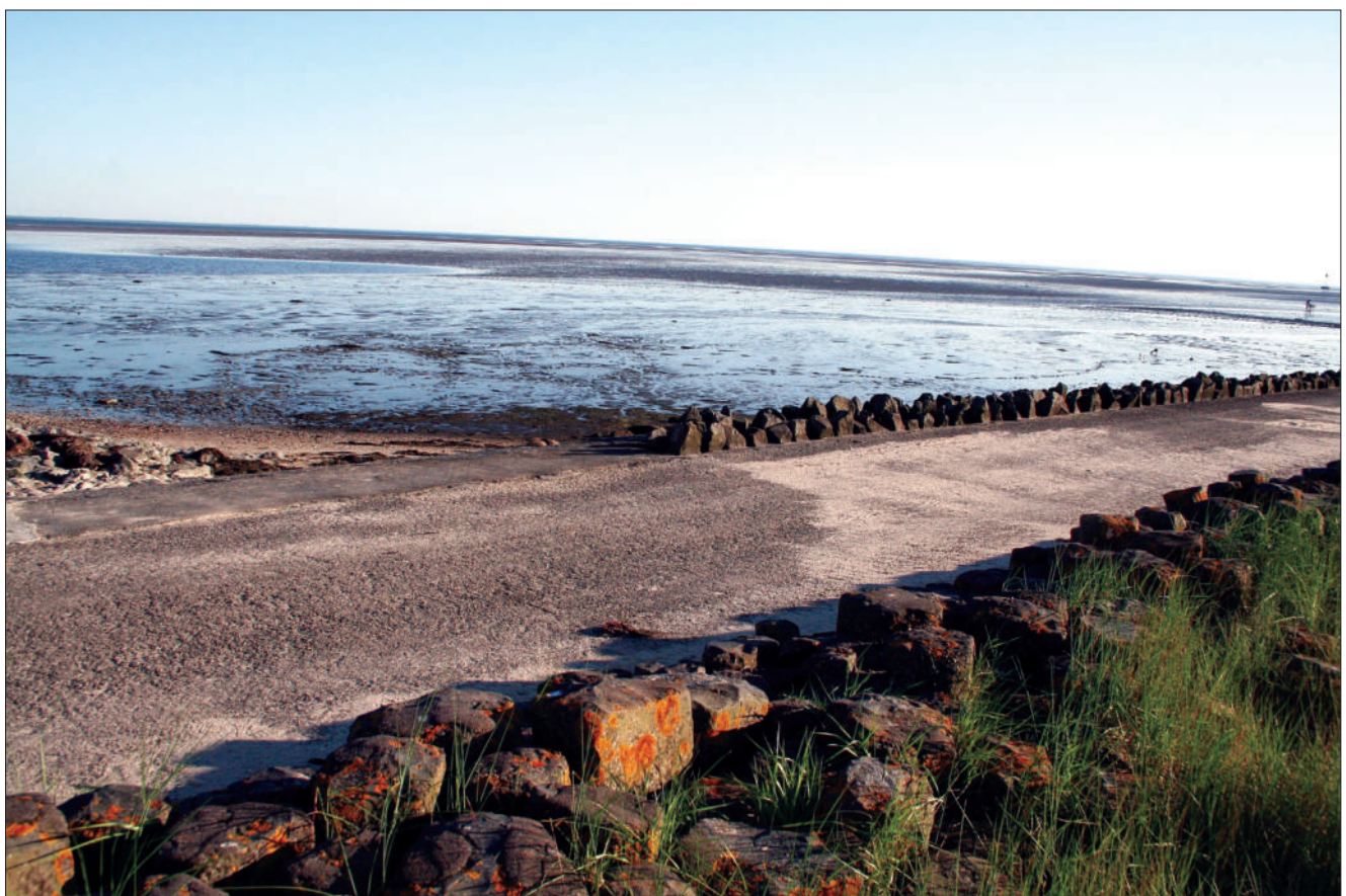
Die Ferienzeit ist für Sandra Weber eine Dazwischen-Zeit. Dieses Dazwischen betrachtet sie in nachstehendem Text.