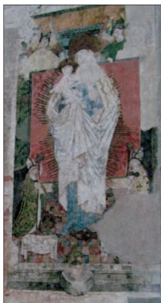
Mittelalterliches Fresko im Münster in Mittelzell (Reichenau).