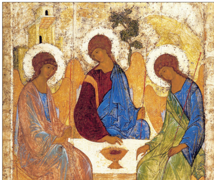
Dreifaltigkeitsdarstellung (Dreieinigkeit) des Ikonenmalers Andrej Rublev