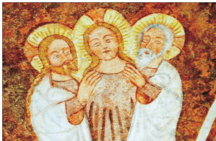
Dreifaltigkeitsdarstellung in in der Kirche in Urschalling