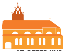
ST. PETER UND PAUL REUTE