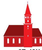
ST. JOH. EVANGELIST MICHELWINNADEN

18.00 Uhr: Eucharistische Anbetung in Osterhofen