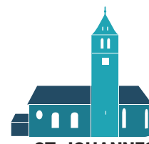
ST. JOHANNES BAPTIST HAISTERKIRCH

11.00 Uhr: Abschlussgottesdienst Cäcilienverband in Pfarrkirche. Die Kirchengemeinde ist dazu herzlich eingeladen. Siehe Seite 3.