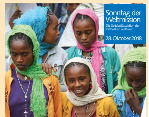
Sonntag der Weltmission Die Solidaritätsaktion der Katholiken weltweit 28. Oktober 2018

Im Anschluss an den Gottesdienst sind Sie ins Gemeindehaus St. Peter zu einer äthiopischen Kaffee-