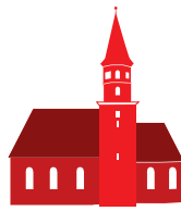
ST. JOH. EVANGELIST MICHELWINNADEN