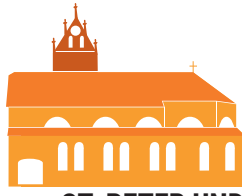
ST. PETER UND PAUL REUTE

22. Sonntag im Jahreskreis 9.00 Uhr: EUCHARISTIE im Pfarrsaal, eventuell Feldgottesdienst, nähere Info folgt.