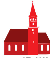
ST. JOH. EVANGELIST MICHELWINNADEN