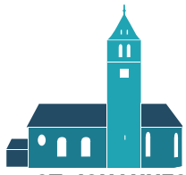
ST. JOHANNES BAPTIST HAISTERKIRCH