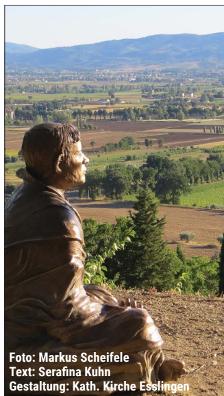
Text: Serafina Kuhn Gestaltung: Kath. Kirche Esslingen