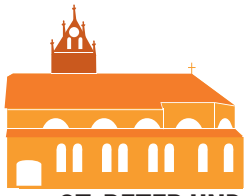
ST. PETER UND PAUL REUTE