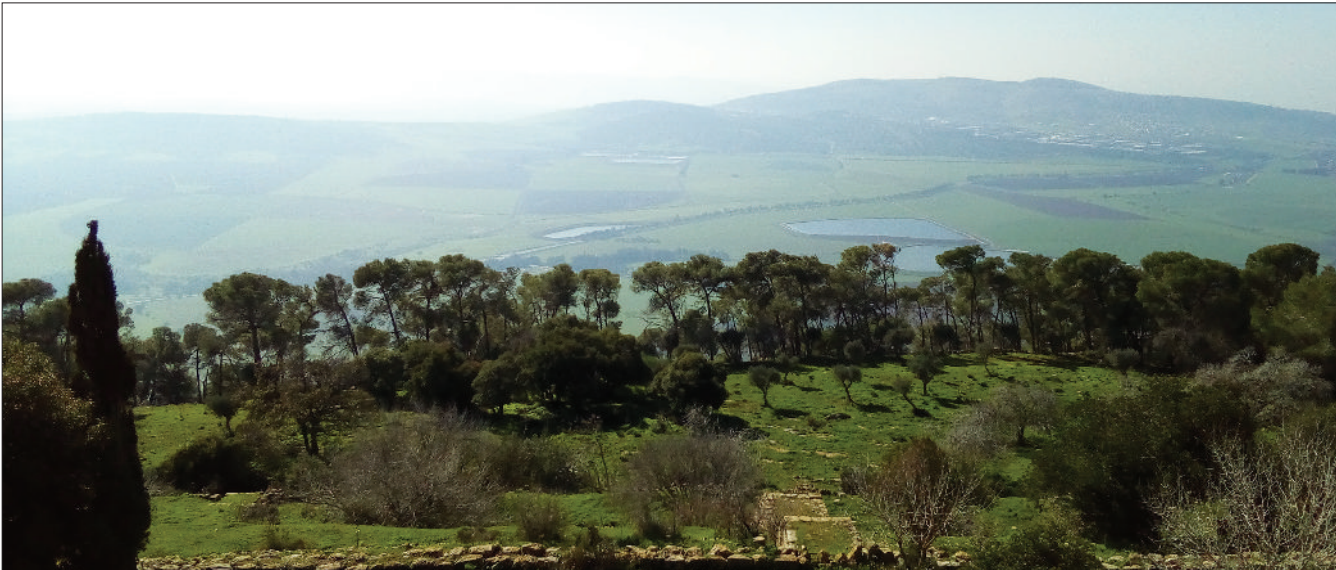
Blick vom Berg Tabor.