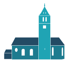
ST. JOHANNES BAPTIST HAISTERKIRCH