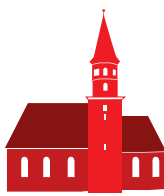
ST. JOH. EVANGELIST MICHELWINNADEN