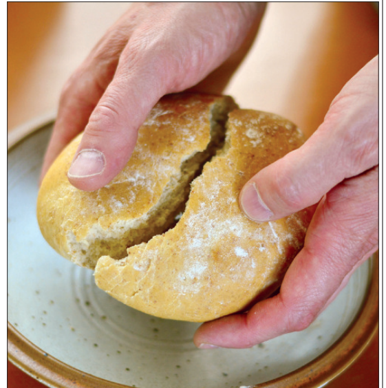
„Und er nahm Brot, sprach das Dankgebet, brach das Brot und reichte es ihnen ...“

Worum es ihm geht, dass fasst er wie in einem Vermächtnis zusammen im Letzten Abendmahl: noch in der Nacht des Verrates und angesichts des Todes – jeder andere wäre eher verzweifelt oder hätte gekniffen – bricht er das Brot, teilt er sich aus und mit. Alle sollen ein für allemal erkennen, wer er ist und wer Gott ist. Ausdrücklich heißt es ja im Kelchwort: „Für euch und für alle.“ Das alles Entscheidende daran ist die Kraft seines Lebens für andere; dadurch stiftet er Versöhnung, schenkt er Vergebung, ermöglicht er Wandlung.