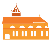
ST. PETER UND PAUL REUTE