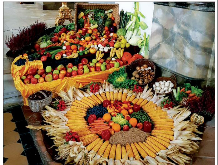
Was hierzulande alles weggeworfen wird ... Der Erntedank-Altar in Michelwinnaden wurde aus vielen noch essbaren Lebensmitteln gestaltet, die im Supermarkt bereits für den Müll aussortiert gewesen waren.

Ein zweiter Gedanke: Ganz bewusst habe ich vorhin von der industriellen Konsum- und Wegwerfgesellschaft geschrieben. Das ist eindrücklich im diesjährigen Erntealtar von Michelwinnaden zu sehen gewesen. Ein wunderschönes Arrangement – Sie können es im Titel-