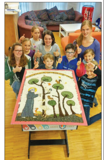
Die Ministranten von Reute-Gaisbeuren – unser Bild zeigt einen Teil der Gruppe – haben dieses Körner-Bild gestaltet. Es zeigt den heiligen Franz von Assisi in der Natur, umgeben von Pflanzen und Tieren.