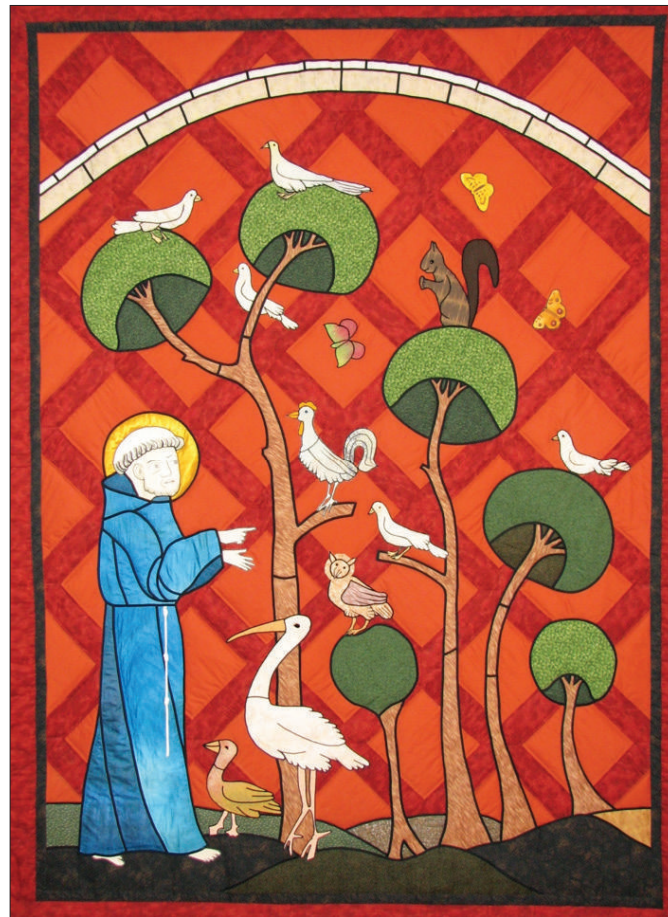
Der mit den Tieren spricht ... Franziskus-Darstellung im Gemeindesaal der Franziskus-Pfarrei in Schwenningen.

In der Tat eine berechtigte Frage, die Sie sich vielleicht auch stellen, wenn Sie lesen, dass wir Franziskanerinnen am 3. 10. zum sogenannten „Transitus“ einladen. Neugierig geworden, ging ich selbst daran, den mir so vertrauten Begriff zu recherchieren. Tatsächlich findet sich auch die Verwendung des Begriffs als musikalische Form, die „unter anderem die Verbindung von konsonanten und dissonanten