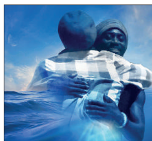
Das seenema zeigt am Mittwoch den Film „Life – Saaraba – Illegal“