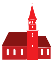
ST. JOH. EVANGELIST MICHELWINNADEN