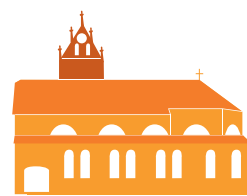
ST. PETER UND PAUL REUTE