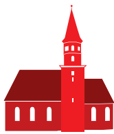
ST. JOH. EVANGELIST MICHELWINNADEN