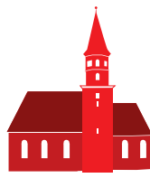
ST. JOH. EVANGELIST MICHELWINNADEN