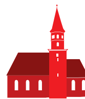
ST. JOH. EVANGELIST MICHELWINNADEN