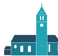
ST. JOHANNES BAPTIST HAISTERKIRCH