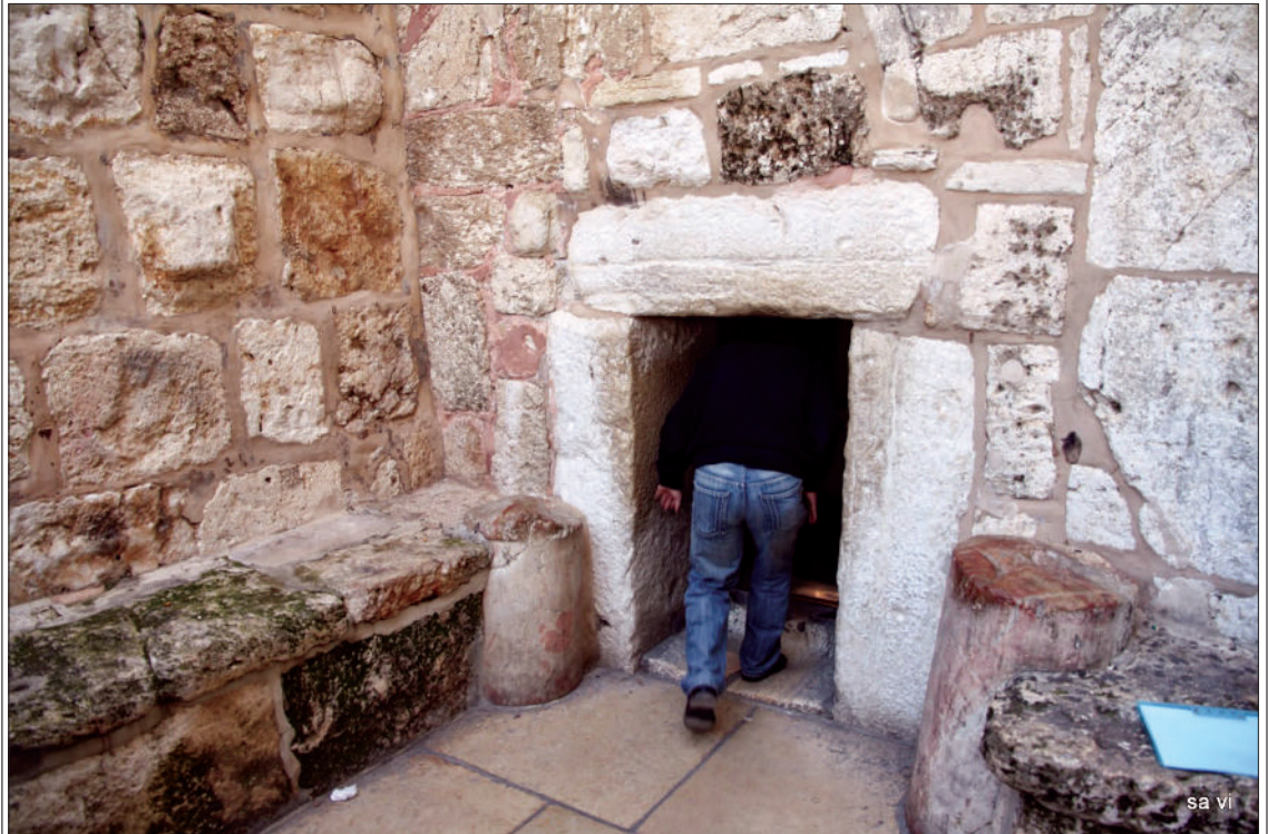
Tür zur Geburtskirche in Bethlehem