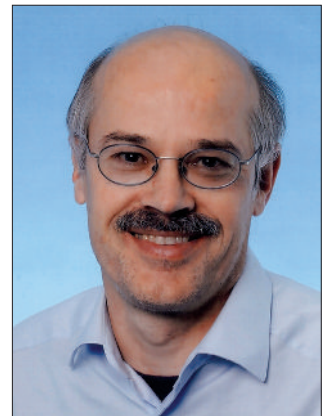
Gottheit tief verborgen (GL 547)

Dieses Lied hat eine sehr schöne Melodie und beschreibt wunderbar das Geheimnis unseres Glaubens in seiner ganzen Fülle.