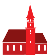
ST. JOH. EVANGELIST MICHELWINNADEN