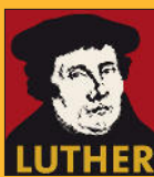
LUTHER Siehe Seite 4

Am 27. / 28. / 29. Juni gibt es eine Veranstaltungsreihe zum Thema „Martin Luther“ mit den örtlichen Pfarrern und Pfarrerrinnen.