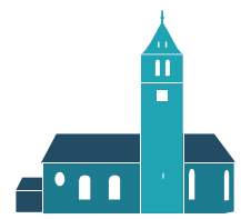
ST. JOHANNES BAPTIST HAISTERKIRCH