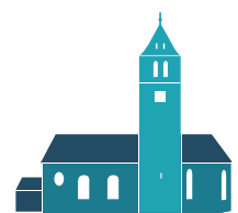
ST. JOHANNES BAPTIST HAISTERKIRCH