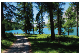
Im Oberengadin.

Montag, 24. Oktober 19.30 Uhr: „Schweiz à la carte“. Die Kurseelsorge Bad Waldsee bietet um 19.30 Uhr im Vortragsraum der Therme einen interaktiven Reisebericht zur Schweiz an. Bei diesem Vortrag bestimmen die Zuhörer den Inhalt und den Verlauf der Reise – es gibt keine Vorgaben, aber eine Vielzahl beeindruckender Bilder aus der Schweiz. Die Städte strahlen unheimlich viel Flair aus. Die Landschaften sind faszinierend. Der Eintritt ist frei. Spenden sind willkommen.