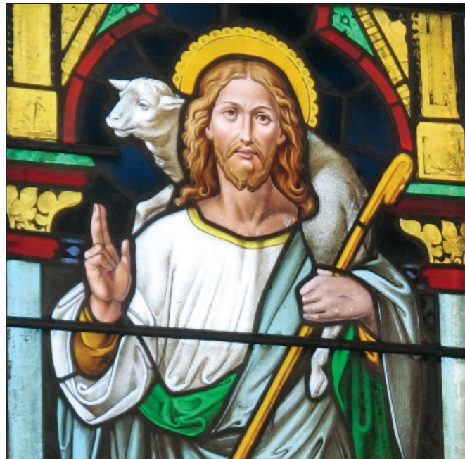
Christus als guten Hirten zeigt ein Fensterbild der Evangelischen Kirche Bad Waldsee (Ausschnitt)

Ähnlich enttäuscht wäre er wohl beim Gemeindefest in Haisterkirch gewesen. Auch dort ließ die Einladung des Kirchengemeinderates, über das eigene Kirchenbild, über Vorstellungen von Kirche und