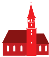
ST. JOH. EVANGELIST MICHELWINNADEN