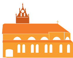
ST. PETER UND PAUL REUTE