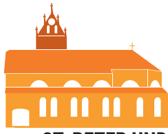
ST. PETER UND PAUL REUTE