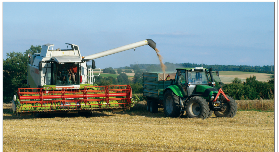
Der Schatz auf unseren Feldern Dankbar dürfen wir sein für eine – trotz des nassen Sommers – recht gute Ernte.

Natürlich kommen dann auch wieder die Fragen: Warum haben wir so viel und andere gar nichts? Ist es richtig, dass ein großer Teil unseres Getreides als Viehfutter verwendet wird oder in die Biogas-Anlage wandert, während andere Menschen verhungern? Was können wir tun, damit es gerechter zugeht?