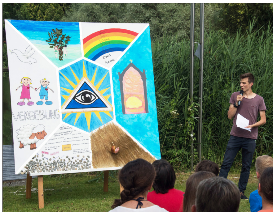
Vom Schatz des Vaterunsers sprachen die Ministranten von St. Peter bei ihrem Fest am vergangenen Sonntag und visualisierten das Gebet des Herrn mit Hilfe dieser Schautafel. Das Werk der Minis kann in der Pfarrkirche noch betrachtet werden.