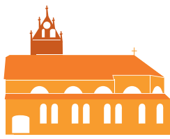
ST. PETER UND PAUL REUTE